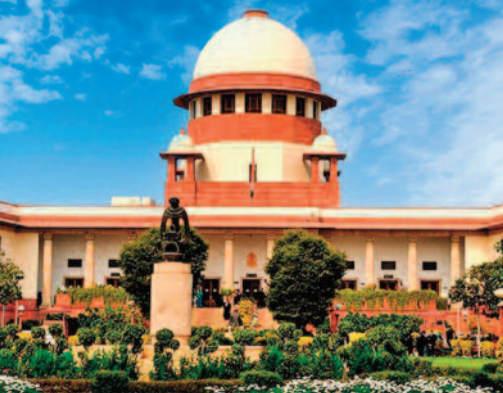
వెల్లడించారు. తల్లి మరణం తర్వాత ఆమె లైసెన్స్ కు దరఖాస్తు చేయగా.. అధికారులు తిరస్కరించారు. ప్రభుత్వ ఆదేశాలనే అలహాబాద్ హైకోర్టు సమర్థించింది. ఆ తీర్పును సుప్రీం వక్కనపెట్టింది. ఆమెకు లైసెన్స్ నిరాకరిస్తూ జారీ చేసిన ఆదేశాలను తోసిపుచ్చింది. నాలుగువారాల్లో ఆమెకు లైసెన్స్ జారీ చేయాలని సంబంధిత అధికారులను ఆదేశించింది.

న్యూఢిల్లీ: కారుణ్య నియామకాల విషయంలో మంగళవారం సుప్రీంకోర్టు కీలక తీర్పు ఇచ్చింది. వాటి విషయంలో వివాహితురాలైన కుమార్తెను మినహాయించడానికి వీలేదని స్పష్టం చేసింది. ఈ నియామకాలకు సంబంధించి కుటుంబ నిర్వహణలో వివాహితురాలైన కుమార్తె భాగం కాదంటూ గతంలో అలహాబాద్ హైకోర్టు ఇచ్చిన తీర్పును తాజాగా సుప్రీంకోర్టు వక్కన పెట్టింది. అర్హత ఉన్న కుమార్తె.. పెళ్లయినదన్న కారణాన్ని సాకుగా చూపి కారుణ్య నియామకాన్ని నిరాకరించడం సరికాదని బాంబే, కర్ణాటక హైకోర్టులు గతంలో ఇచ్చిన తీర్పులతో వికీభవిస్తున్నట్లు వెల్లడించింది. కారుణ్యం ఆధారంగా తనకు ఫెయిర్ ప్రెసిడెంట్ డిలీట్ లైసెన్స్ ఇప్పించాలంటూ ఒక మహిళా పిటిషనర్ అలహాబాద్ హైకోర్టును ఆశ్రయించారు. కుటుంబ నిర్వహణం నుంచి వివాహితురాలైన కుమార్తెను వక్కనపెడుతూ 2019లో ప్రభుత్వం ఇచ్చిన ఆదేశాలను ఆమె సవాలు చేశారు. తనకు వివాహం జరిగినప్పటికీ.. దివ్యాంగురాలైన సోదరిని చూసుకుంటూ, తల్లితో కలిసి ఆ దుకాణాన్ని నిర్వహించినట్లు