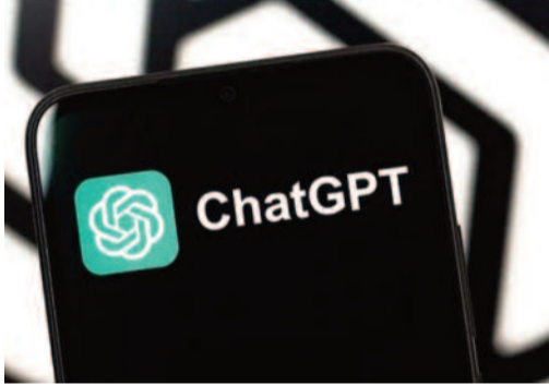
చాట్జీపీటీ ప్రోత్సహించకుండా తాము తీసుకొనే చర్యలు కొనసాగుతాయని వెల్లడించింది.