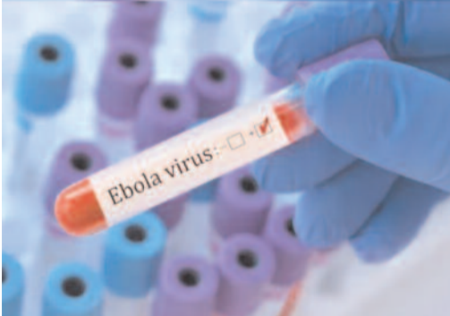
వ్యాప్తిని కూడా నిరోధించవచ్చని వెల్లడించింది. ఈ సందర్భంగా అధికారుల సాయం కోసం 1075 హెల్ప్లైన్ నంబర్ కు కాల్ చేయాలని పేర్కొంది.

న్యూఢిల్లీ: కాంగ్రెస్, ఉగాండా వంటి ఆఫ్రికా దేశాల్లో ఎబోలా వేగంగా వ్యాపిస్తోంది. దీంతో ప్రపంచవ్యాప్తంగా ఆందోళనలు నెలకొన్నాయి. ఈ నేపథ్యంలో భారత ప్రభుత్వం కీలక అడ్వైజరీ జారీ చేసింది. ఎబోలా ప్రభావిత దేశాల్లో ప్రయాణించినా.. లేదా ఆ దేశాల మీదుగా వచ్చిన ప్రయాణికులు స్వీయ నిర్బంధంలోకి వెళ్లాలని సూచించింది. ఆరోగ్య, కుటుంబ సంక్షేమ మంత్రిత్వశాఖ ఈమేరకు మంగళవారం ఓ ప్రకటన చేసింది. భారత్లో ఇప్పటివరకు ఎబోలా కేసులు ఏవీ నిర్ధారణ కాలేదని స్పష్టంచేసింది. ఎవరైనా గత 21 రోజుల్లో ఎబోలా ప్రభావిత దేశం నుంచి వచ్చినా, లేదా ఆ దేశం మీదుగా ప్రయాణించినా.. జ్వరం, తలనొప్పి, కండరాల నొప్పి, వాంతులు, విరేచనాలు వంటి లక్షణాలు కనిపిస్తే స్వీయ నిర్బంధంలోకి వెళ్లాలని సూచించింది. వెంటనే ఆరోగ్య అధికారులకు సమాచారం అందించాలని తెలిపింది. ముందస్తు సమాచారంతో.. మీ ప్రాణాలను కాపాడటంతో పాటు వ్యాధి