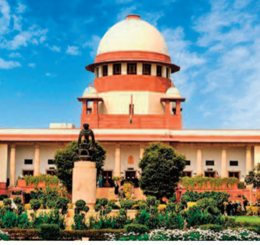
హోదా పొందారు. ఈమె చేరితే సుప్రీం కోర్టులో మహిళా జడ్జిల సంఖ్య 2కు చేరినట్లుంది.