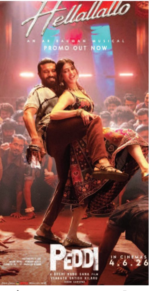
బలవదే అవకాశం ఉంది. ఆ తర్వాత సుకుమార్ సినీమా కూడా విజయవంతమైతే గ్లోబల్ స్టార్ గా ఆయన మార్కెట్ మరింత విస్తరించే అవకాశాలు కనిపిస్తున్నాయి.