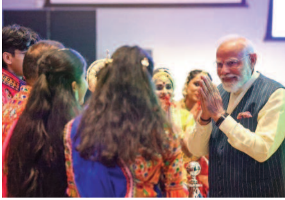
అనిపించింది. భారత్ స్వేచ్ఛానికే ది హాగ్ సజీవ చిహ్నంగా మారిందని అనిపిస్తోంది. నేను నెదర్లాండ్స్ నాయకత్వంతో మాట్లాడిన ప్రతిసారి క్షణం మర్చిపోవద్దు. భారత్లోనే ఓ ఉత్సాహానికి హాజరైంటు

మార్కెట్లోని కొనియాడారు. ఈ సందర్భంగా ఈయూ దేశాలనుద్దేశించి అసక్తికర వ్యాఖ్యలు చేశారు. డిజిటల్ చెల్లింపుల్లో భారత్ అగ్రస్థానంలో ఉంది. నెలకు 20 బిలియన్ల డాలర్ల విలువైన డిజిటల్ చెల్లింపులు జరుగుతున్నాయి. భారత్లో ఒకప్పుడు కేవలం 4 యూనికార్న్ సంస్థలే ఉండేవి. ఇప్పుడు 100కిపైగా ఉన్నాయి. భారత్లో సెమీ కండక్టర్ ఫ్యాబ్లీషన్లు పనులు జరుగుతున్నాయి. మేడిన్ ఇండియా చివ్లు తయారవుతున్నాయి. ఏబి సమ్మిట్, జీ20 సమావేశాలను విజయవంతంగా నిర్వహించగలిగాం. భారత్లో 90 కోట్ల మంది ఓటర్లుగా సమారయ్యారు. 2024 లోక్ సభ ఎన్నికల్లో 64 కోట్ల మంది ఓటు వేశారు. ఈయూ దేశాల జనాభా మొత్తం కలిపినా 64 కోట్ల మంది కూడా లేరని మోడీ తెలిపారు. ఈ సందర్భంగా ప్రధాన మంత్రి నరేంద్ర మోడీ మాట్లాడుతూ.. 'ఇంతటి ప్రేమ, ఉత్సాహాన్ని చూసి నెదర్లాండ్స్లో ఉన్నామన్న సంగతి ఒక్క క్షణం మర్చిపోవద్దు. భారత్లోనే ఓ ఉత్సాహానికి హాజరైంటు