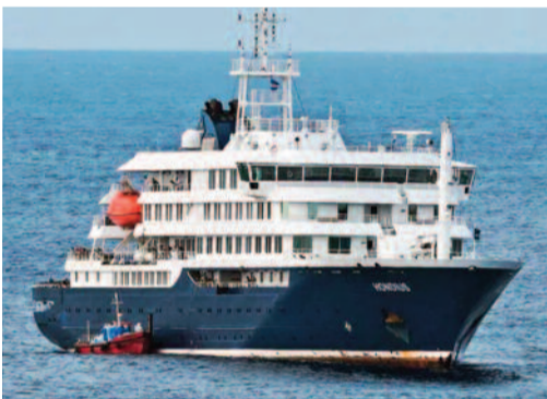
మాన్యులు లేకుండా.. కలిసి భోజం చేసి..