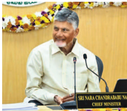
సంగతులను సీఎం గుర్తుచేసుకున్నారు. 'కాలేజీ రోజుల్లో రాయల్ ఎన్ ఫీల్డ్ డ్రైవ్ చేశా.. ఇప్పుడు ఆ సంస్థను ఏపీకి తెచ్చాం' అంటూ ఆనాటి జ్ఞాపకాలను చంద్రబాబు పంచుకున్నారు.

అమరావతి, మే 8 : ఏపీకి ప్రపంచ ప్రఖ్యాత ఐకానిక్ మోటార్ సైకిల్ బ్రాండ్ 'రాయల్ ఎన్ ఫీల్డ్' రాజోతోంది. తిరుపతిలో రూ.2,500 కోట్లతో మోటార్ సైకిల్ తయారీ పరిశ్రమను రాయల్ ఎన్ ఫీల్డ్ సంస్థ ఏర్పాటు చేయనుంది. ఏపీకి రాయల్ ఎన్ ఫీల్డ్ రాకపై ముఖ్యమంత్రి చంద్రబాబు నాయుడు ఎక్స్ లో పోస్ట్ చేశారు. 'రాయలసీమ ఇప్పుడు రాయల్ సీమ' అనే బైటిల్ తో రాయల్ ఎన్ ఫీల్డ్ బైక్ ఉన్న ఫోటోను సీఎం చంద్రబాబు షేర్ చేశారు. ఈ ఫోటోకి 'రాయలసీమకు దూసుకుపోతున్న రాయల్ ఎన్ ఫీల్డ్' అంటూ క్యాప్షన్ పెట్టారు. రెండు రోజుల క్రితం సీఎం చంద్రబాబు అధ్యక్షతన జరిగిన 17వ రాష్ట్రస్థాయి పెట్టుబడుల ప్రోత్సాహక బోర్డు(ఎన్ ఐబీపీ).. రాయల్ ఎన్ ఫీల్డ్ తయారీ పరిశ్రమకు గ్రీన్ సిగ్నల్ ఇచ్చింది. ఈ ప్రాజెక్ట్ కోసం సత్యవేడు పరిధిలోని వన్నెలూరు, రాజ్ కంపృం గ్రామాల్లో సుమారు 267 ఎకరాల భూమిని ప్రభుత్వం కేటాయించింది. ఈ పరిశ్రమ ద్వారా సుమారు 5,000 మంది యువతకు ప్రత్యక్షంగా, పరోక్షంగా ఉపాధి అవకాశాలు లభించనున్నాయి. గురువారం జరిగిన కలెక్టర్ సమావేశంలోనూ ఏపీకి రాయల్ ఎన్ ఫీల్డ్ సంస్థ రావడంపై సీఎం చంద్రబాబు సంతోషం వ్యక్తం చేశారు. కాలేజీ రోజుల్లో బుల్ డెండ్ నడిపిన