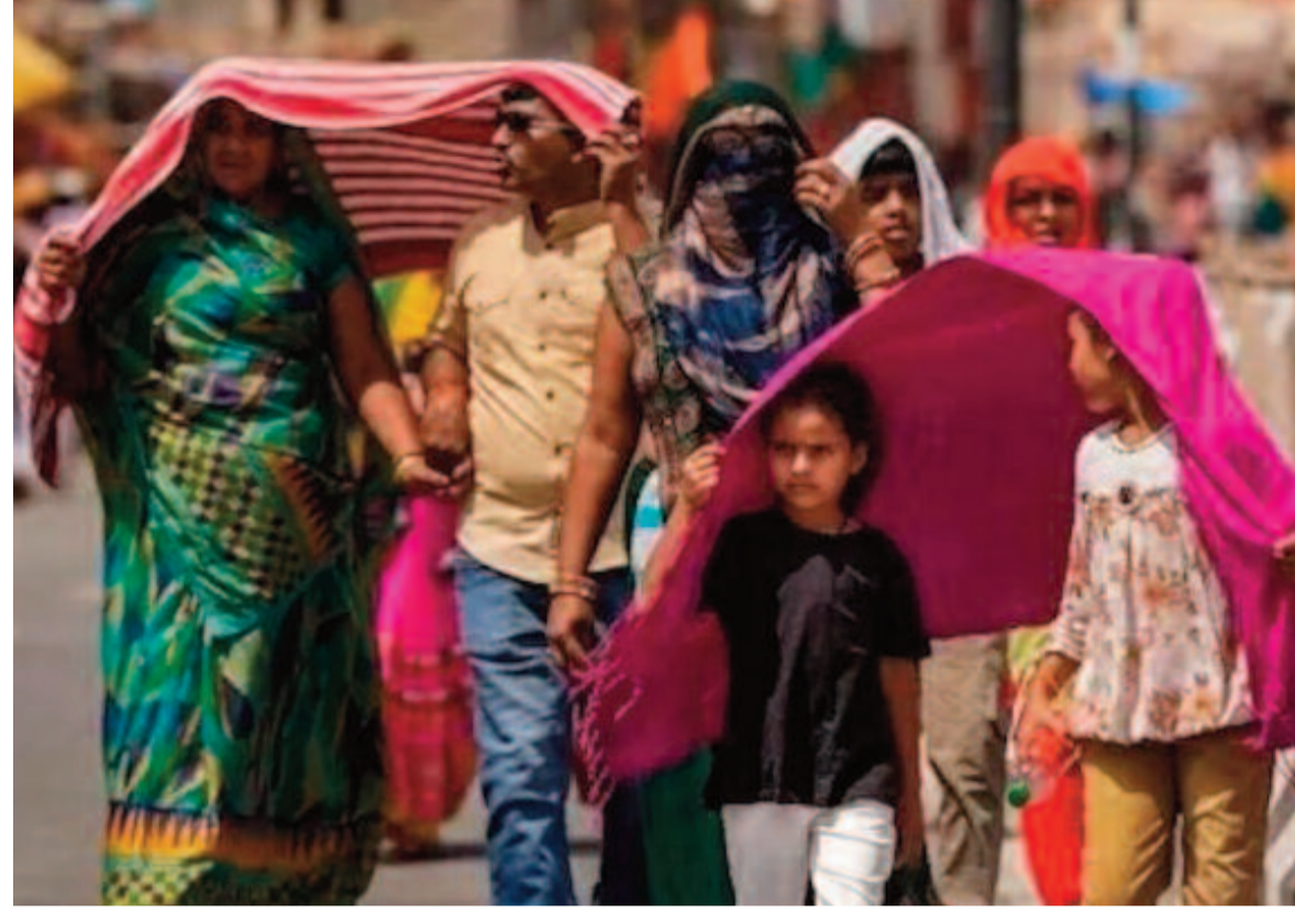
తరచూ నీరు తాగాలి..