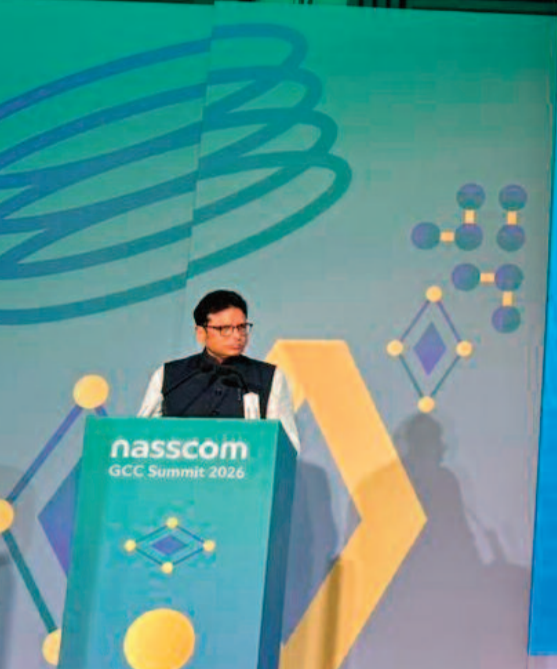
నిర్మించే బాధ్యతను తీసుకున్నామన్నారు. ఆ దిశగానే భారత్ పూర్వర సిటీ, ఏబి సిటీ, మెట్రో విస్తరణ, కొత్త విమానాశ్రయాల అభివృద్ధి, అంతర్జాతీయ, మూసీ ప్రక్షాళన, యంగ్ ఇండియా స్కీమ్ యూనివర్సిటీ, బకం ఇన్ఫ్రాస్ట్రక్చర్ హాల్ తదితర కీలక ప్రాజెక్టులకు శ్రీకారం చుట్టామన్నారు. కేవలం టెక్ కంపెనీలే కాకుండా... బ్యాంకింగ్, లైఫ్

హైదరాబాద్, మే 7 : అంతర్జాతీయ పెట్టుబడులను భారీగా ఆకర్షించే లా... పదేళ్లలో హైదరాబాద్ ను గ్లోబల్ సిటీగా తీర్చిదిద్దేందుకు తమ ప్రభుత్వం ప్రణాళికాబద్ధంగా కృషి చేస్తోందని రాష్ట్ర ఐటీ, పరిశ్రమల శాఖ మంత్రి దుద్దిళ్ల శ్రీధర్ బాబు అన్నారు. మహా నగరాల అభివృద్ధిలో ఎదురయ్యే సవాళ్లను అధిగమించేలా... భవిష్యత్తు అవసరాలకు అనుగుణంగా మౌలిక సదుపాయాల కల్పనకు అధిక ప్రాధాన్య మిస్తోందని వివరించారు. గురువారం ముంబైలో నిర్వహించిన 'నాస్మామ్ జీసీసీ సమ్మిట్ 2026'లో 'బియాండ్ పాలసీ: డిజైన్డ్ టు విన్ ది గ్లోబల్ జీసీసీ రేస్' అనే అంశంపై ఆయన ప్రసంగించారు. ఈ సందర్భంగా మంత్రి శ్రీధర్ బాబు మాట్లాడుతూ... 2047 నాటికి దేశ జీడీపీలో తెలంగాణ వాటాను 10 శాతానికి పెంచాలనే సంకల్పంతో 'తెలంగాణ రైజింగ్ విజన్ 2047'కు శ్రీకారం చుట్టామని వివరించారు. ప్రపంచంలోని అనేక నగరాలు అప్రవృత్త పట్టణీకరణ పథ్య 'అర్బన్ కొల్యాప్' కోర్కెల్లో చిక్కుకున్నాయని, అలాంటి చారిత్రక అప్పడాన్ని హైదరాబాద్ విషయంలో తాము చేయాలనుకోవడం లేదన్నారు. అందుకే... భవిష్యత్తు కోసం ఎదురు చూడకుండా, దాన్ని