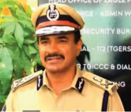
మంచిగా పని చేసి, ఫలితాలు వచ్చేలా చర్యలు తీసుకుంటామన్నారు. ఇక నుంచి యూనివర్సిటీలతోపాటు విద్యాసంస్థల్లో డ్రగ్స్ దొంగిలక్క అ బాధ్యత యజమాన్యాలదేనని డీజీపీ సీపీ ఆనంద్ కుండబద్దలు కొట్టారు. రాష్ట్రవ్యాప్తంగా కేంద్ర ప్రభుత్వ నిధులతో డీ అడిక్షన్ సెంటర్లు ఏర్పాటు చేస్తున్నామని చెప్పారు. జిల్లాల్లో అధికారులు డ్రగ్స్ కేసుల దర్యాప్తు చేయడంలో అలసత్వం ప్రదర్శిస్తున్నారనే అభిప్రాయం వ్యక్తమైందన్నారు. జిల్లాల్లో డ్రగ్స్ కేసుల విచారణపై అధికారులకు ఈగల్ ఫోర్స్ ద్వారా శిక్షణ ఇస్తామని డీజీపీ సీపీ ఆనంద్ వెల్లడించారు.

తొలిసారిగా ఈగల్ ఫోర్స్ పై ఆయన సమీక్ష నిర్వహించారు. ఈ సందర్భంగా డీజీపీ సీపీ ఆనంద్ మాట్లాడుతూ.. పోలీస్ శాఖలోని 35 విభాగాలపై సమీక్ష నిర్వహించామని తెలిపారు. నార్కోటిక్స్ పై అల్ట్రా ఉన్నామని.. డ్రగ్స్ కట్టడి చేయడంలో మొదటి ప్రాధాన్యతతో ఉన్నామన్నారు. రాష్ట్రంలో పాటు దేశవ్యాప్తంగా జరిగిన ఆపరేషన్లపై ఈ సమీక్షలో చర్చించామని వివరించారు. ఈగల్ ఫోర్స్ ద్వారా మంచి ఫలితాలు వచ్చాయని చెప్పారు. అంతర్జాతీయ స్థాయిలో ఆపరేషన్లు నిర్వహించడం ద్వారా నిందితులను అరెస్ట్ చేసి.. వారి వద్ద నుంచి భారీగా డ్రగ్స్ స్వాధీనం చేసుకుని సీజ్ చేశామన్నారు. డ్రగ్స్ విషయంలో సరఫరాతోపాటు డిమాండ్.. ఈ రెండింటిపై దృష్టి సారించాలని పేర్కొన్నారు. ఈగల్లో సిబ్బంది కోరిక ఉందన్నారు. సీవిల్ ఫోర్స్ అవసరం కూడా ఉందని చెప్పారు. డ్రగ్స్ సప్లయ్ అడ్డంకు సీజ్ చేయడం వంటి చర్యలు తీసుకుంటామని ఈ సందర్భంగా డీజీపీ సీపీ ఆనంద్ ప్రకటించారు. జిల్లాలో కమిషన్లు, ఎన్ఫోర్స్ కూడా డ్రగ్స్ కట్టడిలో కీలక పాత్ర పోషించాల్సి ఉందని అభిప్రాయపడ్డారు. జిల్లా స్థాయిలో నిఘా లోపించిందని ఈ సమీక్ష ద్వారా బహిష్కరించబడిన చెప్పారు. నార్కోటిక్ ఐదు పోలీస్ స్టేషన్లు