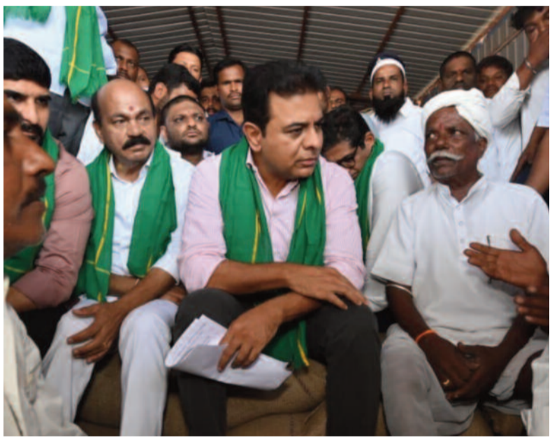
-మిగతా 2 లో..