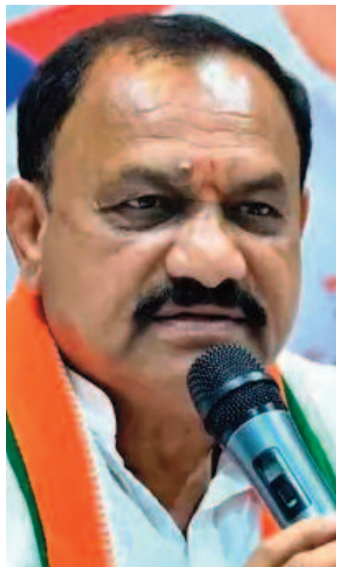
-మిగతా 2 లో..