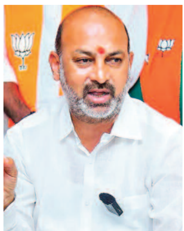
-మిగతా 2 లో..