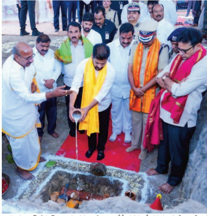
హైదరాబాద్, ఏప్రిల్ 28 : నూతనంగా ఏర్పాటు చేసే నగరంలో తమనూ కలపాలని స్థానిక గ్రామాల ప్రజలు డిమాండ్ చేస్తున్నారని వెల్లడించారు. ప్రజల్ని అభివృద్ధిలో భాగస్వాములు చేయడమే కాంగ్రెస్ ప్రభుత్వ లక్ష్యమని రేవంత్ చెప్పుకొచ్చారు. రంగారెడ్డి జిల్లా మిర్జాపేట్ లో ప్యూచర్ సిటీ పోలీస్ కమిషనరేట్ భవన నిర్మాణానికి ముఖ్యమంత్రి -మగతా 2 లో..

ప్యూచర్ కోసమే.. సిటీ నిర్మాణం ప్రపంచ దేశాలకు ఢిల్లీగా నగర ప్రణాళిక 60 ఎకరాల్లో స్కైల్ యూనివర్సిటీ నిర్మాణం ఓఆర్ఆర్ పెద్ద అసెట్ కానుంది అంతర్జాతీయ స్థాయి బస్ టెర్మినల్ మెట్రో విస్తరణతో అద్భుత కనెక్టివిటీ గ్రామాల ప్రజలు సిటీలో భాగం కావాలి ప్రజాప్రతినిధులు సిటీ కోసం కృషి చేయాలి మూడు బుల్డింగ్ టైమ్స్ కేంద్రంగా శంషాబాద్ ప్యూచర్ సిటీ పోలీస్ కమిషనరేట్ నిర్మాణానికి సీఎం రేవంత్ శంకుస్థాపన