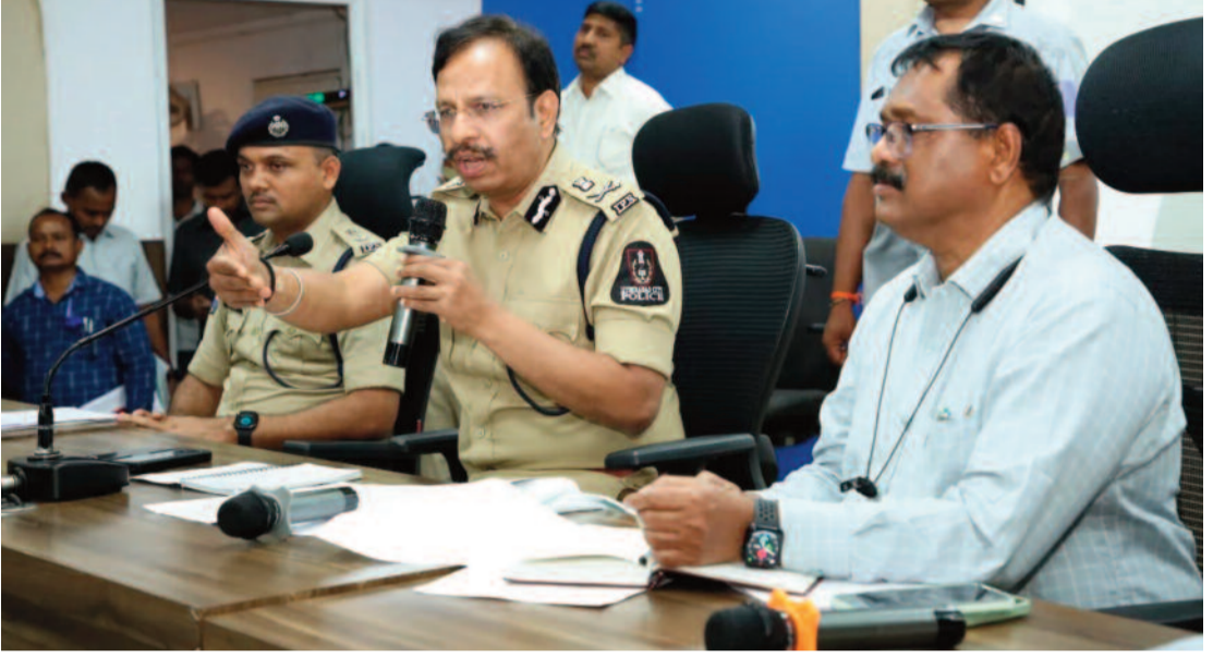
అకౌంట్లపై నిరంతర పర్యవేక్షణ కోసం ఆర్బిఐ, బ్యాంకులు, పోలీసులతో కూడిన జాయింట్ వర్కింగ్ గ్రూప్ ఏర్పాటు చేయాలని ప్రతిపాదించారు. ప్రజలు అప్రమత్తంగా ఉండాలని విజ్ఞప్తి చేశారు. వాట్సాప్, టెలిగ్రామ్ వంటి వేదికల్లో వచ్చే అధిక లాభాల