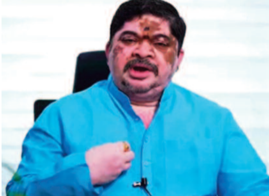
అంతర్గతం, నాయకత్వ అంశాలు ఉన్నాయని పేర్కొన్నారు. ఆర్టీసీ ఇప్పుడిప్పుడే కోలుకుంటుంది.. అన్ని అంశాలను పరిష్కరిస్తామని చెప్పారు. మిమ్మల్ని ఎవరూ అడ్డకోరని.. ప్రజల స్వామ్య పద్ధతిలో మీ నాయకులు నిరసన తెలపవచ్చు.. ప్రజలపై ఒత్తిడి తీసుకురావచ్చని అన్నారు. అయితే పేద ప్రజల ప్రయాణాలకు ఇబ్బంది కలగజేయవద్దని విజ్ఞప్తి చేశారు. మీ నాయకులు నిరసన తెలపవచ్చు.. మిగతా వారంతా విధుల్లో చేరి ప్రయాణికులకు ఇబ్బంది లేకుండా చేయాలని కోరారు.

హైదరాబాద్, ఏప్రిల్ 22: ఆర్టీసీ సమ్మెను విరమించాలని రాష్ట్ర రవాణా శాఖ మంత్రి పొన్నం ప్రభాకర్ విజ్ఞప్తి చేశారు. సమస్యలకు సమ్మె పరిష్కారం కాదని ఆయన సూచించారు. సమస్యల పరిష్కారానికి నలుగురు అధికారులతో కమిటీ ఏర్పాటు చేసింది.. 4 వారాల్లో నివేదిక ఇవ్వాలని ఆదేశించామని తెలిపారు. కమిటీల పేరుతో కాలయాపన చేసేమనడం పొరపాటు అని స్పష్టం చేశారు. ఆర్టీసీ కార్మికులు లేవనెత్తిన 32 అంశాల్లో 29 అంశాలకు ప్రభుత్వం నుంచి ఎటువంటి వ్యతిరేకత లేదని పొన్నం ప్రభాకర్ తెలిపారు. అవన్నీ వెంటనే పరిష్కారమయ్యే అంశాలని పేర్కొన్నారు. ఆర్టీసీ విలీనం, గుర్తింపు సంఘాల ఎన్నికలు రెండు మెంబర్లతో ఉన్నాయని అన్నారు. ఈ రెండు అంశాల్లో పలు సాంకేతిక అంశాలు చరించాల్సి ఉందన్నారు. వీటిపై అభ్యయనం చేసేందుకే నాలుగు వారాల గడువు అడిగామని వివరించారు. ఈ రెండు అంశాలు కూడా సీఎం, డిప్యూటీ సీఎం దగ్గర చర్చి స్థాపన అన్నారు. ఆర్టీసీ విలీనం ఆలస్యమైనప్పటికీ, ఉద్యోగులకు ఒకటో తారీఖు జీతాలు వస్తున్నాయని పొన్నం ప్రభాకర్ తెలిపారు. గుర్తింపు సంఘాల ఎన్నికల విషయంలో నాయకుల మధ్య