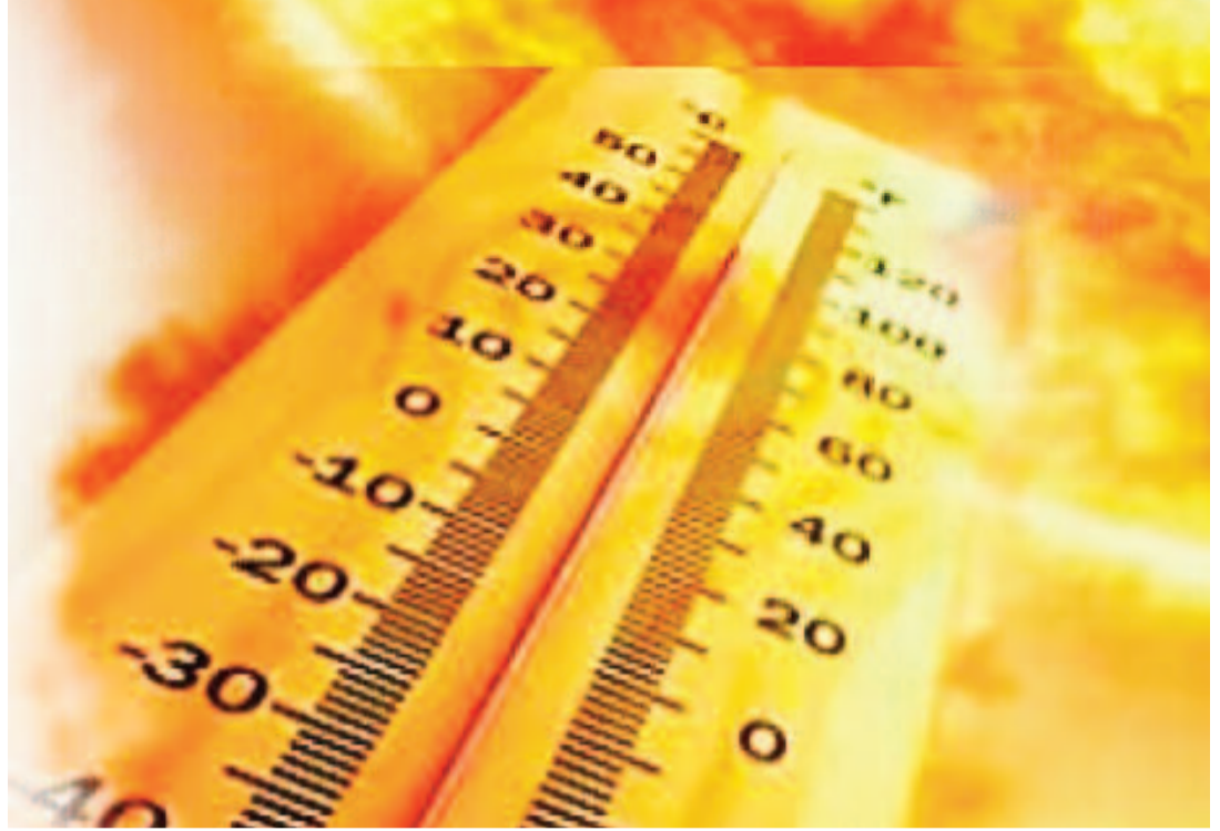
గాలులు సాధారణ రోజులు కన్నా ఎక్కువ ప్రభావం చూపుతాయి.

హైదరాబాద్, ఏప్రిల్ 16: ఎండల తీవ్రతతో తెలుగు రాష్ట్రాలు నిప్పుల కొలిమిగా మారాయి. గత నెల రోజులుగా ఆయా ప్రాంతాల్లో విభిన్న వాతావరణం చోటు చేసుకుంది. కొన్నిచోట్ల అకాల వర్షాలు, పలుచోట్ల వడగళ్ల వర్షం, చూసాం. ఇప్పుడు ఉన్నట్టుండి వడగాడ్లులు చప్పుడు వింటున్నాం. భానుడి భగభగలతో జనం మిట్ట మధ్యాహ్నం బయటకు వెళ్ళే లేక ఉన్న చోటనే ఇంట్లోనే, కార్యాలయంలోనే ఉండిపోతున్నారు. తెలంగాణలో అన్ని జిల్లాలకు వాతావరణ శాఖ ఆరంజ్ అలర్ట్ జారీ చేసింది. తెలంగాణ వ్యాప్తంగా ఎండలు దంచికొడుతున్నాయి. పలు జిల్లాల్లో గరిష్ట ఉష్ణోగ్రతలు సమోద అవుతున్నాయి. ఈ నేపథ్యంలో ఉమ్మడి ఆదిలాబాద్, ఖమ్మం, మహబూబ్ నగర్ తో పాటు నిజామాబాద్, జగిత్యాల, రాజన్న సిరిసిల్ల, మేడ్చల్ మల్లాజ్ గిరి, హైదరాబాద్ జిల్లాలకు ఆరంజ్ హెచ్చరికలు జారీ చేశారు. రానున్న మూడు రోజులు గరిష్ట ఉష్ణోగ్రతలు క్రమేపి ఒకటి నుంచి రెండు డిగ్రీలు పెరిగితే అవకాశం ఉన్నట్లు వాతావరణ శాఖ తెలిపింది. మూడు రోజులు పలు జిల్లాల్లో వడగాడ్లులు వీచే అవకాశం ఉందని, ఆరంజ్ హెచ్చరికలు జారీ చేసిన జిల్లాల్లో గరిష్ట ఉష్ణోగ్రతలు 41 నుంచి 44 డిగ్రీల మేర సమోదయ్యే అవకాశం ఉన్నట్లు వెల్లడించింది. ఉమ్మడి ఆదిలాబాద్ తో పాటు నాగర్ కర్నూల్, వనపర్తి, నారాయణపేట, జోగులాంబ గద్వాల జిల్లాల్లో వడగాడ్లులు వీచే అవకాశం అవకాశం ఉందని పేర్కొంది. కొన్ని ప్రాంతాలకు ఎల్లో అలర్ట్ జారీ చేశారు. ఎండ వేడిమి నుండి తట్టుకోలేని పరిస్థితులు ఎదురవుతున్నాయి. ఇప్పటికే రోడ్డు నిర్మాణ పనులుగా ఉన్నాయి. ఏప్రిల్ 19 నుంచి మే 31 వరకు ప్రత్యేక వాతావరణం చూస్తామని ఈ కారణంగా కొన్ని కలిసేమైన పరిస్థితులు ఎదురవుతాయని వాతావరణ శాఖ అలర్ట్ చేసింది. వడ