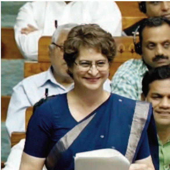
సాయిదా ముందుకు తేవడం, మహిళా అభ్యున్నతి కోసం మోడీ అతిపెద్ద నిర్ణయం తీసుకున్నారని మోడీయారో చర్చ జరిపించడం, ప్రతి ఒక్కరూ ఆయనకు మద్దతు ఇస్తేలా చేయడం, ఇలా

ప్రతిపక్షాలను సందిగ్ధంలో పడేయడం అంతా ప్లాన్ అంటూ ఆమె ఆరోపించారు. ఈ వ్యాఖ్యలతో అమిత్ షాతో పాటు మంత్రులు కిరెన్ రిజిజు నవ్వులు. అంతకముందు ప్రధాని సరేంద్ర మోడీ చేసిన ప్రసంగాన్ని తప్పవట్టిన ఆమె.. అందులో జవహర్ లాల్ నెహ్రూ పేరు వినిపించకపోవడం గమనార్హం అని అన్నారు. మహిళల హక్కుల పట్ల బీజేపీ నేతలే ఛాంపియన్లుగా భావిస్తున్నారని ఆమె విమర్శించారు. మోడీ ప్రసంగంలో నెహ్రూ పేరు వినిపించకపోవడం ఆశ్చర్యం కలిగించింది. రిజర్వేషన్లపై 2018లోనే ప్రధాని సరేంద్ర మోడీకి రాహుల్ గాంధీ లేఖ రాశారు. 2019లోపే రిజర్వేషన్లు అమలు చేయాలని రాహుల్ కోరారు. ప్రధాని మోడీ సగం సమాచారం మాత్రమే వెల్లడించారు. ఇవాళ ప్రధానంగా రిజర్వేషన్ల కోటపై చర్చ కాదు.. లోక్ సభ సీట్లను 850కి పెంచడంపైనే.. మోడీ ప్రభుత్వం లోక్ సభ సీట్ల పెంపుపైనే ఆసక్తి కనబరుస్తోంది. ఆ విషయంలో ప్రభుత్వానికి అంత తొందరయిన ప్రయోగం గాంధీ ప్రత్యేకం. మహిళా రిజర్వేషన్ బిల్లను ఎవరూ వ్యతిరేకించలేదు. రాహుల్ స్వయంగా మోడీ దగ్గరకు వెళ్లి మరీ మద్దతు తెలిపారు. ఆ బిల్లుపై క్రిటిక్స్ మోడీ.. కాంగ్రెస్ కు ఇవ్వలేదు. దేశ మహిళలకు కాంగ్రెస్ ఎంతో సేవ చేసింది. బిల్లు విషయంలో మహిళలను బీజేపీ తప్పుదోవ పట్టిస్తోంది. మహిళా బిల్లును ఎవరూ వ్యతిరేకిస్తున్నారో మోడీ చెప్పాలి. కులగణనకు మోడీ ఎందుకు భయపడుతున్నారు? ఓటిసీలకు న్యాయం జరగాలి.. వారి హక్కులను ఎవరూ కాలరాయలేరు' అని ప్రయోగం గాంధీ వ్యాఖ్యానించారు.