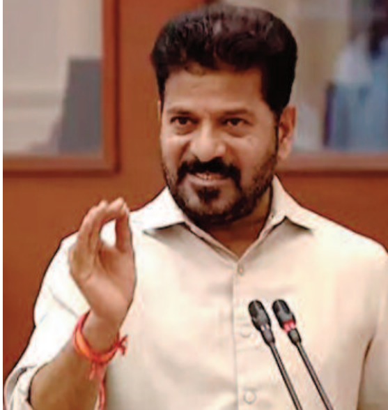
నిర్వహణ నిర్దేశిస్తాయని అన్నారు. నగరాలపైనే రాష్ట్రాల ప్రగతి ఆధారపడి ఉంటుందని తెలిపారు.

హైదరాబాద్, మార్చి 23 : రూ.15 వేల కోట్లతో మెట్రోను స్వాధీనం చేసుకున్నామని వెల్లడించారు. ఏ రాష్ట్రంలోనైనా ఎయిర్పోర్టులకు మెట్రో కనెక్టివిటీ ఉంటుందని.. కానీ తెలంగాణలో అలాంటి పరిస్థితి లేదని తెలిపారు. జూన్, జూలైలోపు ఎలివేటెడ్ కారిడార్ల నిర్మాణం పూర్తి చేస్తామని స్పష్టం చేశారు. వంజాగుట్ట, హైటెక్ సిటీ, జూబ్లీహిల్స్ లో ఎలివేటెడ్ కారిడార్లు ఉన్నాయని సీఎం రేవంత్ రెడ్డి తెలిపారు. రూ.24 వేల కోట్లతో 74 కిలోమీటర్ల మేరకు మెట్రోను విస్తరిస్తామని తెలిపారు. దేశంలోనే ఎక్కువ లీని విధంగా బేగంపేట ఎయిర్పోర్టు మధ్య నుంచి అండర్ పాస్ నిర్మిస్తున్నామని పేర్కొన్నారు. సిగ్నల్స్ దగ్గర వాహనాలు ఆగకుండా వెళ్లాలనేదే తమ ఆలోచన అని చెప్పుకొచ్చారు. ఫుట్ పాత్ల ఆక్రమణలే కొన్ని ప్రమాదాలకు కారణమని అన్నారు. చిరు వ్యాపారులకు ఇబ్బంది ఉన్నా ఆక్రమణలు తొలగిస్తామని స్పష్టం చేశారు. ఢిల్లీ మాదిరిగా కాలుష్య సగరం కాకూడదనే పార్ట్ పాలసీ తీసుకువచ్చామని వివరించారు. ప్రతిపక్షాల నేతలు పార్టీపాలసీపై ఆరోపణలు, అసత్య ప్రచారాలు చేయొద్దని హితవు పలికారు. అభివృద్ధికి అడ్డంకులు సృష్టించొద్దని కోరారు. సగరం నుంచి బయటకు వెళ్లేందుకు ఎలివేటెడ్ కారిడార్లు ఏర్పాటు చేస్తున్నామని తెలిపారు. మూసీ ప్రాజెక్టుతోపాటు ఎలివేటెడ్ కనెక్టివిటీ అండర్ పాస్ నిర్మిస్తున్నామని పేర్కొన్నారు. సిగ్నల్స్ దగ్గర వాహనాలు ఆగకుండా వెళ్లాలనేదే తమ ఆలోచన అని చెప్పుకొచ్చారు. ఫుట్ పాత్ల ఆక్రమణలే కొన్ని ప్రమాదాలకు కారణమని అన్నారు. చిరు వ్యాపారులకు ఇబ్బంది ఉన్నా ఆక్రమణలు తొలగిస్తామని స్పష్టం చేశారు. ఢిల్లీ మాదిరిగా కాలుష్య సగరం కాకూడదనే పార్ట్ పాలసీ తీసుకువచ్చామని వివరించారు.