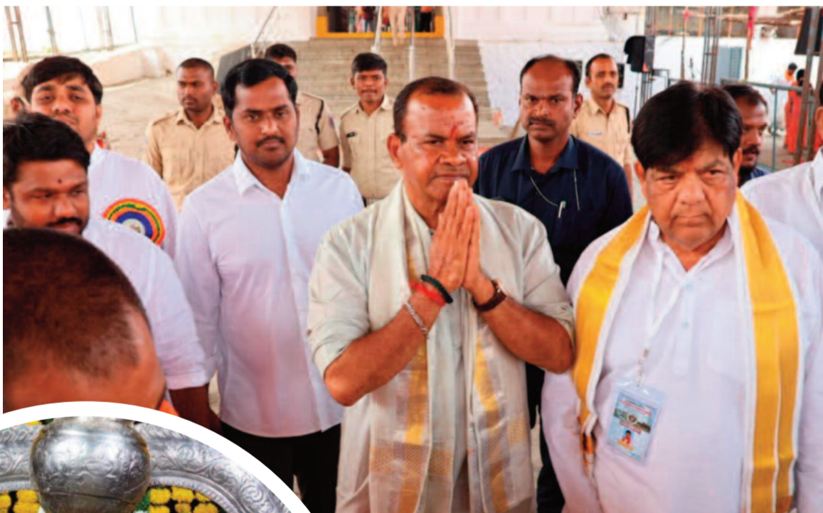
ప్రజా ప్రతినిధులు గానీ పట్టించుకోవడం లేదు. దీనితో ప్రతి ఏటా ఇదే పరిస్థితి

ఇదిలా ఉండగా, రాష్ట్ర రాజధాని హైదరాబాద్ కు కీసరగుట్ట క్షేత్రం అతి సమీపంలో ఉన్నందున ప్రతియేటా ఈ క్షేత్రానికి వస్తున్న భక్తుల