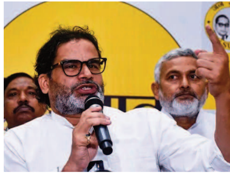
పార్టీ కనీసం ఖాతా కూడా తెరవకపోవడం గమనార్హం. శుక్రవారం ఉదయం ఎన్నికల కౌంటింగ్ ప్రారంభం కాగానే పోస్టల్ కౌంటింగ్ లో రెండు స్థానాల్లో ముందంజలో ఉండగా.. ఇప్పుడు అది కూడా లేదు.

• వ్యూహాకర్తే పాకిచ్చిన సొంత రాష్ట్రం • భాతా కూడా తెరవడం కష్టమే