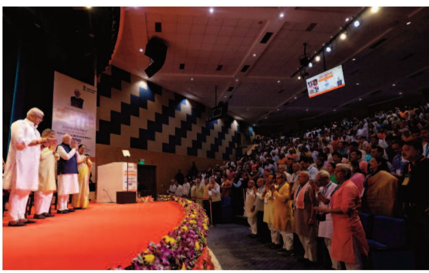
నేనులు బనాయింపడం, నిషేధించడం వంటి అనేక ప్రయత్నాలు జరిగాయి. అయినా ఆర్ఎస్ఎస్ అన్నింటినీ తట్టుకొని నిలబడింది' అని మోదీ పేర్కొన్నారు. అనేక సవాళ్లు ఎదుర్కొన్నప్పటికీ ఈ సంస్థ నేటికీ బలంగా నిలబడిందన్నారు. అవిశ్రాంతంగా దేశానికి, సమాజానికి సేవ చేస్తోందన్నారు. వారి ప్రయత్నాలు దేశంపై ఉన్న భక్తి, త్యాగం, నిబద్ధతకు నిదర్శనమన్నారు. తాజాగా విడుదల చేసిన

నేషన్ ఫస్ట్ ఆర్ఎస్ఎస్ నినాదం ప్రధాని మోదీ మాట్లాడుతూ.. ఆర్ఎస్ఎస్ సేవలను ఈ సందర్భంగా ప్రశంసించారు. ఆర్ఎస్ఎస్ అనేది ఒక సంస్థ కాదని.. వ్యక్తిత్వ వికాసం ద్వారా దేశ నిర్మాణం కోసం పాటు పడే శక్తి అని అభివర్ణించారు. నేను అనే అహోన్ని వీడి.. మనం అనే సామాజిక భావన వైపు నడిపించే ప్రయాణమే ఆర్ఎస్ఎస్ అని వివరించారు. ఆర్ఎస్ఎస్ అనేక అనుబంధ సంస్థలు ఉన్నా.. వాటి అంతిమ లక్ష్యం ఒక్కటేనని.. జాతీయతే అగ్రస్థానమని స్పష్టం చేశారు. అంతేకాకుండా ఈ అనుబంధ సంస్థల మధ్య వైరుధ్యాలు ఉండవని పేర్కొన్నారు. సంఘ వ్యవస్థాపకులు డాక్టర్ హెడ్గేవార్ దేశ నిర్మాణంతో పాటు స్వాతంత్ర్య పోరాటం కోసం ఆయన చేసిన సేవలను ఈ సందర్భంగా మోదీ గుర్తు చేశారు. ఇక స్వాతంత్ర్యం అనంతరం ఆర్ఎస్ఎస్ పై అనేక దాడులు జరిగాయని.. వాటన్నింటినీ తట్టుకుని నిలబడిందని ప్రధాని మోదీ తెలిపారు. శతాబ్ది ఉత్సవాలు జరుపుకోంటున్న ఆర్ఎస్ఎస్ కు శుభాకాంక్షలు తెలిపారు. పేదల జీవితాల్లో మార్పు తెచ్చేందుకు ఆర్ఎస్ఎస్ కృషి చేస్తోందన్నారు. అసత్యంపై సత్యం, అన్యాయంపై న్యాయం, అధర్మంపై ధర్మం గెలుస్తుందన్నారు. 'నది తన ప్రవాహంతో అనేక భూముల్లో పచ్చదనం పెంచుతుంది. నదీ ప్రవాహంలా ఆర్ఎస్ఎస్ కూడా ప్రజలకు సేవ చేస్తోంది. విద్య, వైద్యం, రైతులకు అనేకవిధాలుగా సంఘ సేవలు అందిస్తోంది. మన సంస్కృతి, సంప్రదాయాల పరిరక్షణకు నిరంతరం కృషి చేస్తోంది. ఆర్ఎస్ఎస్ చేసే ప్రతి పనిలో నేషన్ ఫస్ట్ అనేది కన్నీస్తోంది. గతంలో సంస్థ స్ఫూర్తిని అణచివేసేందుకు తప్పదు