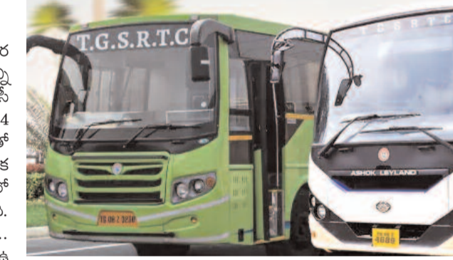
వస్తుండటంతో.. చాలా మినిమం ఛార్జీలు వసూలు చేస్తున్నాయని తెలిపారు. రేపే దసరా కాబట్టి ఇప్పటికే సగానికి పైగా సిటీ ఖాళీ అవుతుంది.. రాత్రికి మొత్తం ఖాళీ అయ్యే అవకాశం ఉంది.

ప్రత్యేక బస్సులు నడుపుతున్న ఆర్టీసీ హైదరాబాద్, అక్టోబర్ 1 : దసరా పండుగ సందర్భంగా హైదరాబాద్ నగర వాసులు సాంతూళ్లకు పయనమయ్యారు. ప్రస్తుతం బస్ స్టాండ్లు అన్ని జనాలతో కిక్కిరిసిపోయాయి. ప్రయాణికుల రద్దీ దృష్ట్యా తెలంగాణ ఆర్టీసీ ప్రత్యేక బస్సులను ఏర్పాటు చేసింది. దసరాకి ప్రత్యేకంగా 7754 బస్సులను ప్రయాణికుల కోసం ఏర్పాటు చేసింది. జీబీఎస్, ఎంజీబీఎస్ తో పాటు ఆరంఫర్, ఎల్సీ నగర్, ఉప్పల్ వంటి రద్దీ ప్రాంతాల్లో తాత్కాలిక బస్ స్టాండ్లను ఆర్టీసీ అధికారులు ఏర్పాటు చేశారు. గతంలో పండుగలకు జనాలు ఆర్టీసీ బస్సులలో కిక్కిరిసి రద్దీతో వెళ్లాలి వచ్చేది. ఇప్పుడు పండుగలకు అధిక సంఖ్యలో బస్సులను ఏర్పాటు చేయడంతో.. ప్రయాణికులు ప్రశాంతంగా జర్నీ చేస్తున్నారు. బస్సులు చాలా ఉండడంతో చాల మంది ప్రయాణికులు నంతోషం వ్యక్తం చేస్తున్నారు. ఇక 2013 జీవో ప్రకారమే పండుగలకు అదనపు ఛార్జీలు వసూలు చేస్తున్నాయని ఆర్టీసీ అధికారులు చెప్పారు. రిటర్న్ జర్నీ ఖాళీగా రావాల్సి