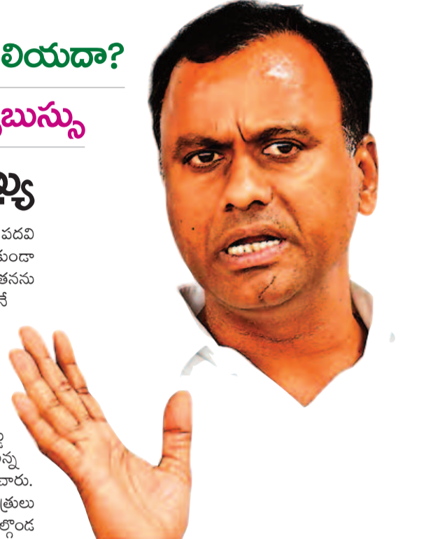
అన్నదమ్ములం ఉన్నామని పాల్టీలోకి తీసుకున్నప్పుడు తెలియదా? లోకీనభ ఎన్నికల్లో రెండోసారి హామీ ఇచ్చినప్పుడు తెలియదా? అన్నదమ్ముల్లో ఇద్దరం సమర్థులమే.. ఇద్దరికీ మంత్రి పదవులు ఇస్తే తప్పించి? అలస్యమైనా సరే ఓపిక పడుతున్నా? అని అన్నారు.

ఇప్పుడు ఎందుకు అంటున్నారని ప్రశ్నించారు. తనకు మంత్రి పదవి ఇవ్వడం ఎందుకు కుదరటం లేదు.. ఆ సమాకరణలు రాకుండా ఎవరడ్డుకుంటున్నారు..? అని ప్రశ్నలు వర్షం కురిపించారు. తనను కాంగ్రెస్ పార్టీలోకి తీసుకునే సమయంలో మంత్రి పదవి ఇస్తాననే తీసుకున్నారని గుర్తుచేశారు. అప్పుడు తాము ఇద్దరం అన్నదమ్ములం కాంగ్రెస్లోనే ఉన్నామని తెలియదా అని నిలదీశారు. పార్లమెంట్ ఎన్నికల సమయంలో మంత్రి పదవి ఇస్తానని రెండోసారి హామీ ఇచ్చారని.. అప్పుడు కూడా కాంగ్రెస్ పార్టీలో తాము ఇద్దరం అన్నదమ్ములం ఉన్నామని గుర్తుచేశారు అని కోమటిరెడ్డి రాజ్ గోపాల్ రెడ్డి ప్రశ్నించారు. ఒక్క దాటే పరకు ఓడ మల్లయ్య.. ఒక్క దాటకే బోడి మల్లయ్య అన్న చందంగా కొంతమంది నేతల పరిస్థితి ఉందని విమర్శించారు. తొమ్మిది మంది ఎమ్మెల్యేలు ఉన్న ఖమ్మం జిల్లాకి ముగ్గురు మంత్రులు ఉన్నారని కూడా అని ప్రశ్నించారు. 11 మంది ఎమ్మెల్యేలు ఉన్న నల్గొండ జిల్లాకు ముగ్గురు మంత్రులు ఉండటం తప్పా అని నిలదీశారు. ఇద్దరం అన్నదమ్ముల్లో ఇద్దరం సమర్థులమేనని, ఇద్దరం గట్టి వాళ్ళమేనని.. ఇద్దరికీ మంత్రి పదవులు ఇస్తే తప్పించిని ప్రశ్నలు వర్షం కురిపించారు. మంత్రి పదవి ఇవ్వడానికి అలస్యమైనా సరే తాను ఓపిక పడుతానని కోమటిరెడ్డి రాజ్ గోపాల్ రెడ్డి పేర్కొన్నారు. మంత్రి పదవి ఇస్తామని మాటిచ్చారు.. ఇచ్చినప్పుడు ఇవ్వండి. ఇద్దరం