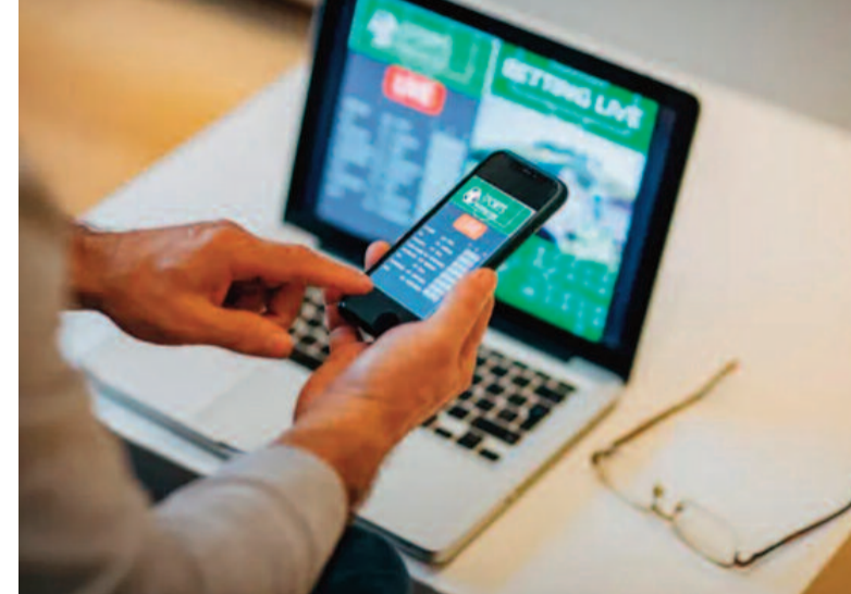
లభించిన అధికార వర్గాలు తెలిపాయి. నేడు దీన్ని కోర్టునభిల్ ప్రవేశపెట్టే అవకాశం ఉంది.

న్యూఢిల్లీ, ఆగస్టు 20 : ఆన్లైన్ బెట్టింగ్ యాప్స్ ఆగడాలు ఇటీవల మరి పెరిగిపోయాయి. దీన్ని అరికట్టడంలో భాగంగా 'ఆన్లైన్ గేమింగ్ బిల్లు'ను తీసుకొచ్చేందుకు కేంద్రం సిద్ధమైన సంగతి తెలిసింది. ఈ బిల్లుపై ఆందోళన వ్యక్తం చేస్తూ.. ఆల్ ఇండియా గేమింగ్ ఫెడరేషన్ కేంద్ర హోం మంత్రి అమిత్ షాకు లేఖ రాసింది. ఆన్లైన్ బెట్టింగ్ లను అరికట్టేందుకు కేంద్రం తీసుకొచ్చే బిల్లు కారణంగా తమ రంగానికి తీవ్ర నష్టం కలుగుతుందని విజిఎఫ్ ఆందోళన వ్యక్తం చేసింది. ఇది అమిత్ షాకి వస్తే తమ పరిశ్రమకు భారీ నష్టం జరుగుతుందని, కోట్లమంది చట్టబద్ధమైన గేమర్లు అక్రమంగా నెట్ వర్కులను నడిపేవారి వైపు వెళ్లాలా చేస్తుందని ఆవేదన వ్యక్తం చేసింది. అంతేకాక.. ఈ రంగంలోని అనేకమంది ఉద్యోగులపై కూడా దీని ప్రభావం ఉంటుందని హెచ్చరించింది. ఈ సందర్భంగా దీని పూర్తిగా నిషేధం విధించేకంటే.. దానిపై నియంత్రణ చర్యలు తీసుకోవాలని కేంద్రానికి సూచించింది. ఆటగాళ్లను రక్షించడంలో పాలు వారు బాధ్యతాయుతంగా ఆడాలా చర్యలు తీసుకోవాలని కోరింది. కొత్త ఆవిష్కరణల